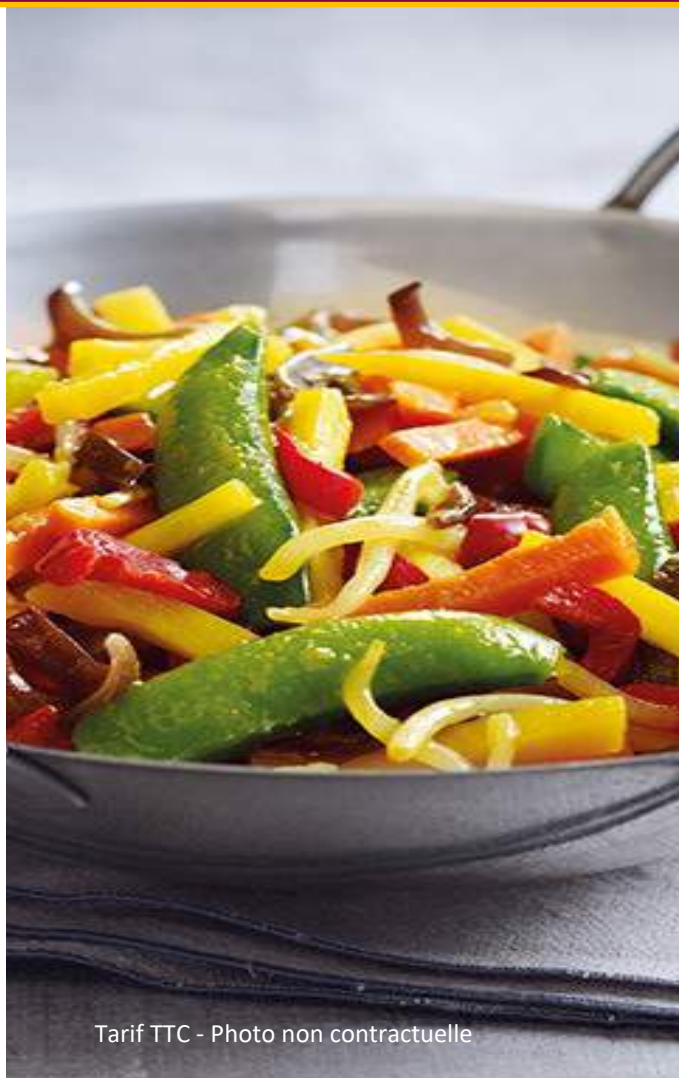
Tarif TTC - Photo non contractuelle

Wok de nouilles chinoises, légumes, gingembre et cacahuètes