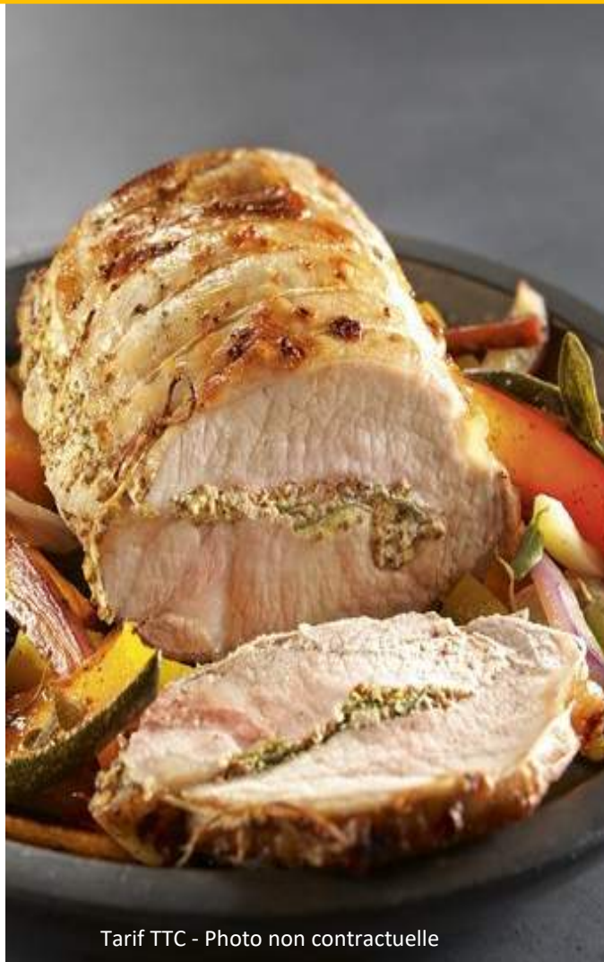
Tarif TTC - Photo non contractuelle

Filet de bœuf aux morilles, polenta crémeuse et légumes rôtis au jus de viande