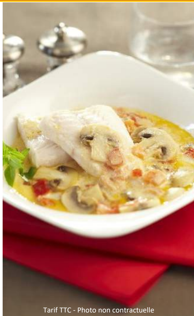
Tarif TTC - Photo non contractuelle