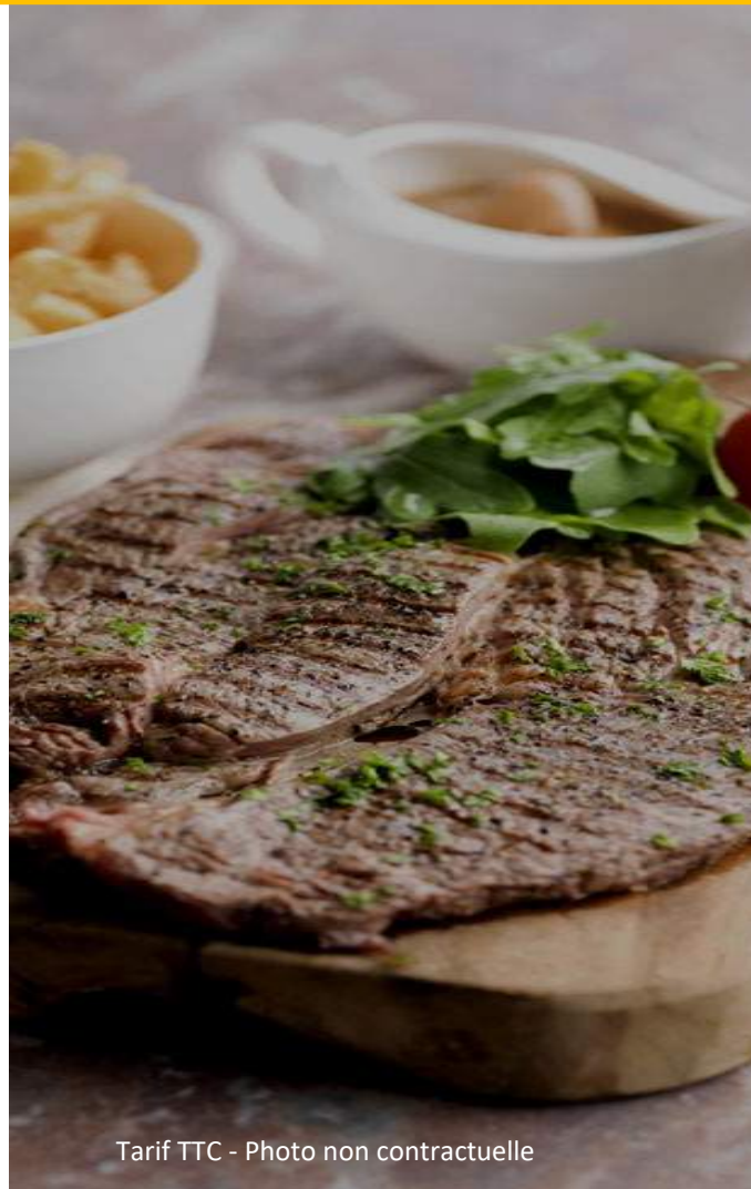
Tarif TTC - Photo non contractuelle

Cuisse de pintade aux cèpes, légumes croquants de saison et jus court